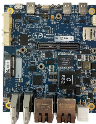
AGX111Rogue キャリアボード (AGX Xavier 32GB&64GB) (AGX Xavier Industrial)